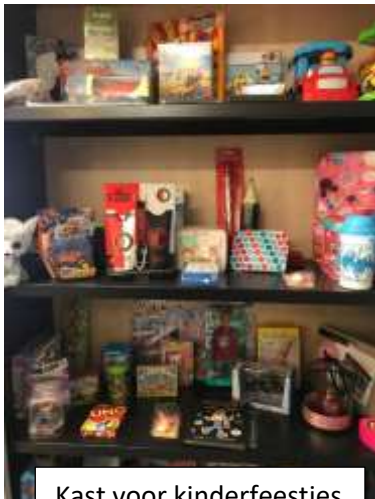
Kast voor kinderfeestjes

Naast het pakket van cadeaus mogen ouders ook drie maal per jaar een cadeautje uitzoeken wanneer hun kind uitgenodigd is voor een kinderfeestje. Hiervoor is een speciale kast ingericht met kleinere cadeautjes. Voor een kraamcadeautje kan men ook gebruik maken van het speelgoedaanbod. Alle uitgiften worden gedocumenteerd.