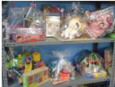
Cadeau-pakketjes in de winkel

De gezinnen kunnen na inschrijving 1 maal per kwartaal zelf een pakket van cadeaus uitkiezen uit de winkel welke bij hun kind(eren) past. Dit pakket van cadeaus varieert per kwartaal, afhankelijk van het ingezamelde speelgoed en de activiteiten per kwartaal. Voor onze organisatie is het belangrijk dat het kind cadeaus krijgt welke hij of zij leuk vindt! Iedere speelgoeduitgifte wordt in een bestand bijgehouden.