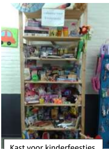
Kast voor kinderfeestjes

Naast het verjaardagscadeau mogen ouders ook drie maal per jaar een cadeautje uitzoeken wanneer hun kind uitgenodigd is voor een kinderfeestje. Hiervoor is een speciale kast ingericht met kleinere cadeautjes. Voor een kraamcadeautje kan men ook gebruik maken van het speelgoedaanbod. Alle uitgiften worden gedocumenteerd.