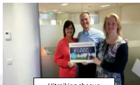
Uitreiking cheque ING Nederland Fonds

In februari 2016 werd onze stichting door het ING Nederland Fonds gekozen als één van de vijf goede doelen. Uiteindelijk resulteerde dit in maart 2016 in een donatie van € 1.000,00.