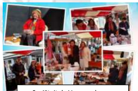
Sociëteit de Vrouwenkamer

Net als in 2016, heeft in 2016 Sociëteit de Vrouwenkamer zich tijdens de koningsmarkt wederom ingezet om geld in te zamelen voor Stichting Speel je mee. Dankzij de inzet van Sociëteit de Vrouwenkamer mochten wij een donatie van € 1.400,00 ontvangen!