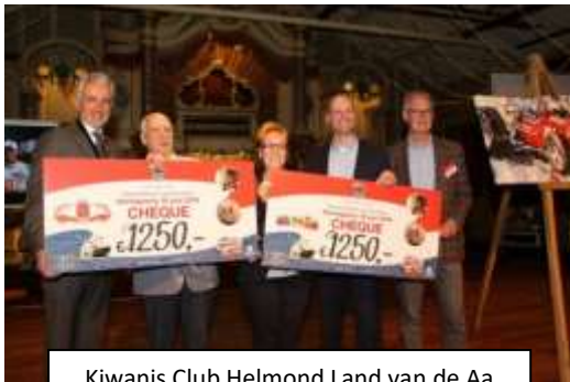
Kiwanis Club Helmond Land van de Aa

Op 20 juni 2016 werden wij blij verrast door de mededeling dat wij ook dit jaar weer werden geselecteerd als één van de goede doelen bij de Haringparty van de Kiwanis Club, Helmond Land van de Aa. Een mooi cheque van € 2.250,00 werd ons overhandigd.