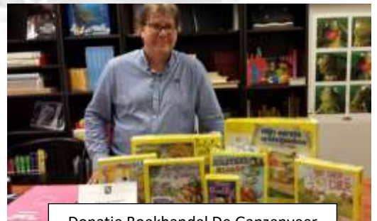
Donatie Boekhandel De Ganzenveer

Vanuit eerdere contacten van De Beursvloer Helmond ontvingen wij een donatie van Boekhandel De Ganzenveer. Naast de afgebeelde spellen mocht wij ook nog eens voor € 100,00 aan boeken uit de winkel uitzoeken.