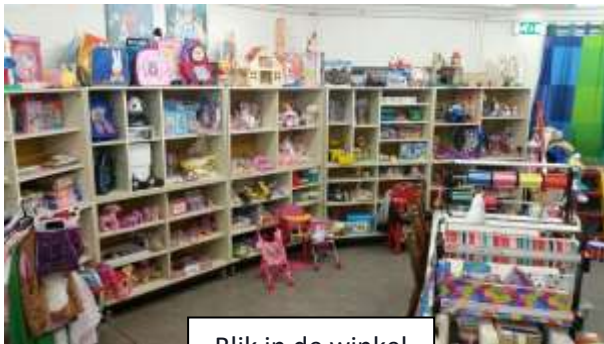
Blik in de winkel

De gezinnen kunnen na inschrijving zelf een cadeau uitkiezen uit de winkel welke bij hun jarige kind(eren) past. Dit is een belangrijk speerpunt van de organisatie, het kind moet uiteraard wel iets krijgen wat hij of zij leuk vindt! Iedere speelgoeduitgifte wordt in een bestand bijgehouden.