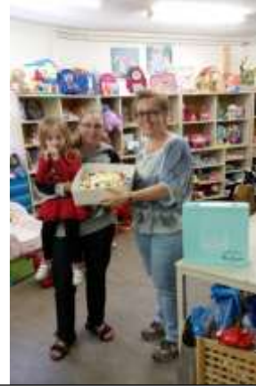
Één van de winnaars van de facebookactie

Op 19 juni 2016 hebben wij in verband met onze 3 e verjaardag de uitslag van de loterij, via een facebookactie, bekend gemaakt. De winnaars ontvingen een mooie taart van Patisserie De Swart.