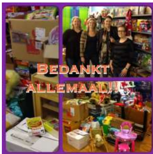
Inzameling Verwende Apen

Een hele leuke troost was de enorme lading speelgoed die de dames van Verwende Apen na een inzameling in hun winkel in Someren eind januari kwamen brengen!