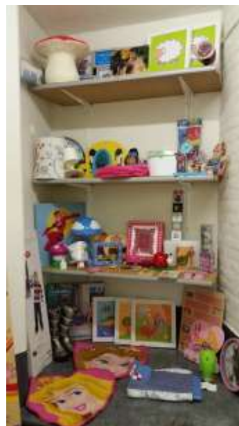
en de snuffelhoek

De ouder wordt gestimuleerd om naast het zelf uitgekozen cadeau ook een boek aan hun kind te geven. Hiermee wil de organisatie het belang van lezen benadrukken.