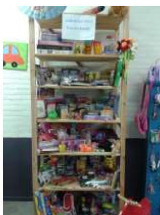
Kast voor kinderfeestjes

Naast het verjaardagscadeau mogen ouders ook drie maal per jaar een cadeautje uitzoeken wanneer hun kind uitgenodigd is voor een kinderfeestje. Hiervoor is een speciale kast ingericht met kleinere cadeautjes. Voor een kraamcadeautje kan men ook gebruik maken van het speelgoedaanbod. Alle uitgiften worden gedocumenteerd.