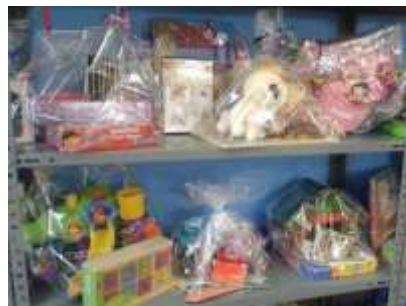
Cadeau-pakketjes in de winkel

Door middel van het inzamelen van (tweedehands) speelgoed wordt een breed assortiment opgebouwd dat gecontroleerd en schoongemaakt wordt. Het goede speelgoed wordt in de winkel aangeboden aan gezinnen die leven op bijstandsniveau. Speelgoed wat niet aan de eisen voldoet die de Stichting stelt om als cadeau weg te geven, wordt in de snuffelhoek gezet, tenzij het ook daar niet meer voor kwalificeert. Dit minimale “rest”-speelgoed vindt vaak nog een bestemming buiten de Stichting. De Stichting streeft ernaar om zo min mogelijk weg te gooien.