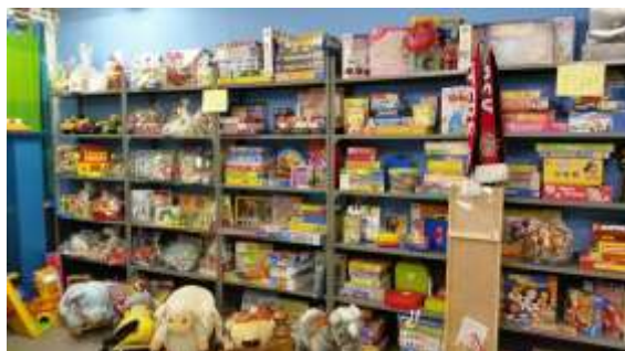
Blik in de winkel